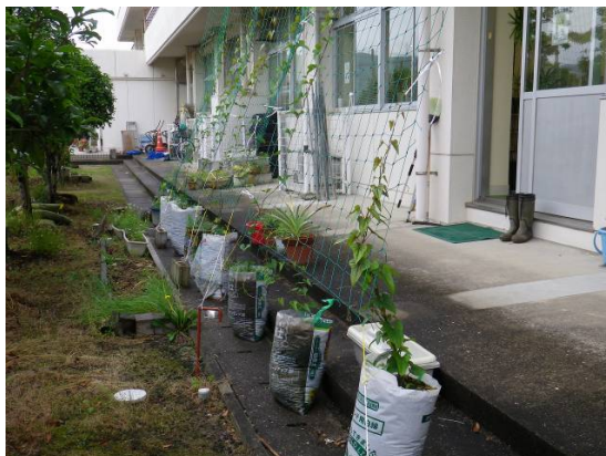
肥料袋を利用した山芋のグリーンカーテン

今年は震災の影響もあり、節電が叫ばれていますが、グリーンカーテンに限らず、節電する意識や心がけは一時の流行で終わらないで欲しいし、自分もそうありたいと思っています。