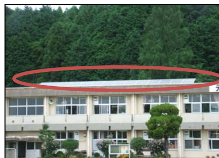
学校屋上に設置されているパネル（56枚）

平成22年から太陽光発電システムを、小学校5校（牧島、波多津東、南波多、山代東、山代西）、中学校3校（啓成、東陵、山代）、大川町コミュニティセンター（大川公民館）、松浦公民館の計10ヶ所に新しく設置しています。平成22年4月から7月までの4ヶ月で、小中学校では約39,200kwh、公民館では約8,800kwhを発電し、約17,952kg（25mプール約22個分）のCO 2 排出量を削減しました。